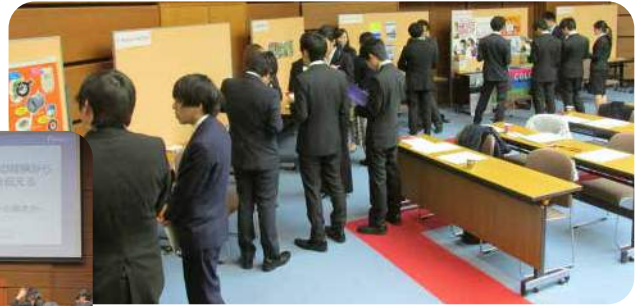
各企業様との懇談(ポスターセッション)