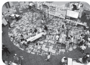
イオンモール木曾川