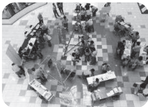
イオンモール扶桑

発砲ブロックの倒壊体験、ロープワークの体験などが行われました。愛知連盟では、9月2日にイオンモール扶桑、9月23日にイオンモール木曾川にて実施されました。